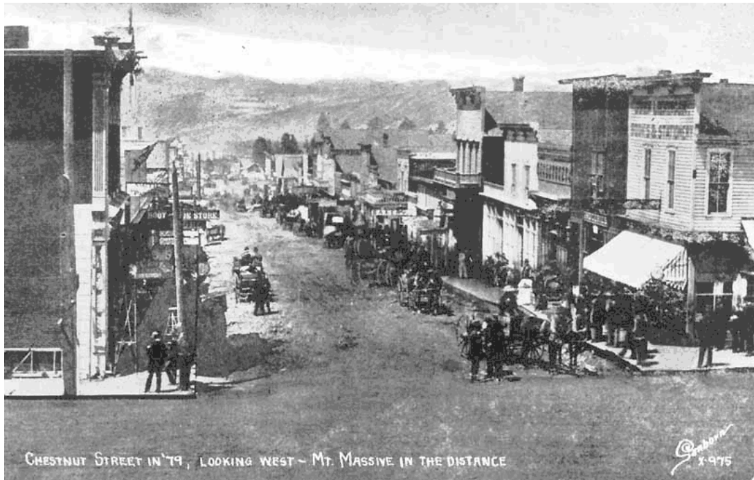
Leadville - Colorado