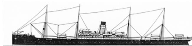
- Le SS Southwark -